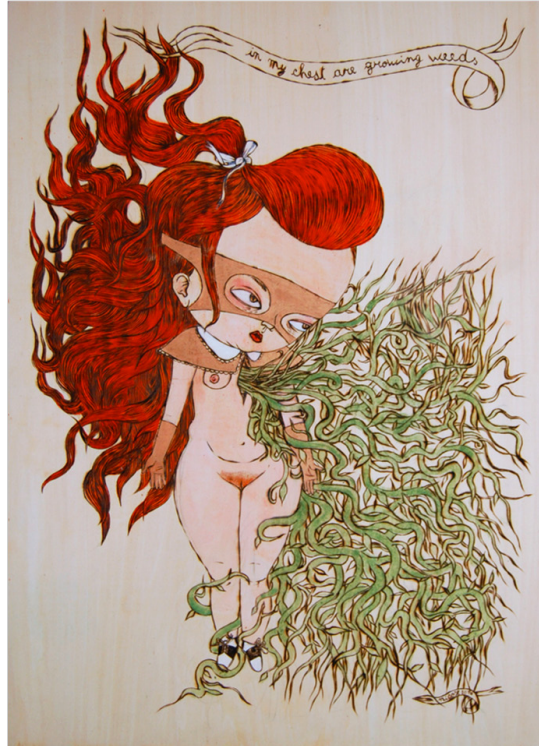
In my chest are growing weeds - pyrogravure et huile sur bois