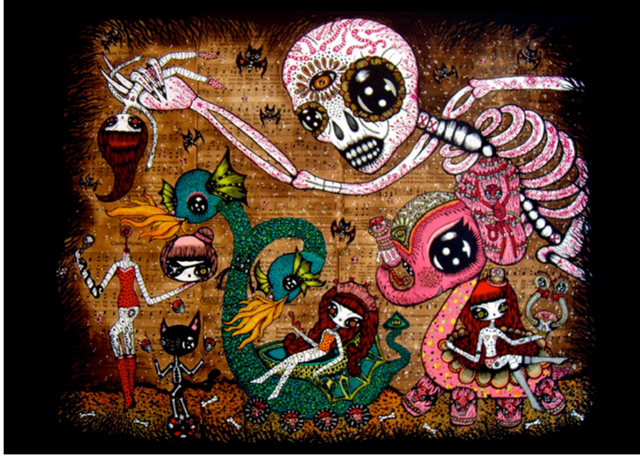
Skeleton Parade - mixed media

Ciou est née en 1981 à Toulouse où elle est récemment retournée vivre et travailler.